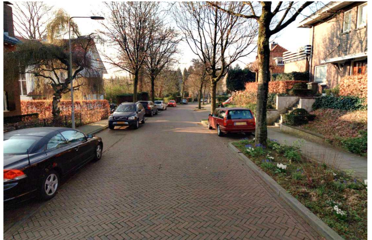
Van Goyenstraat (13m breed)

2. Na overleg met de school zijn we tot de conclusie gekomen dat het parkeren een groot probleem is (op piekmomenten), maar dat de veiligheid van de scholieren het belangrijkste is. De scholieren hebben een veilige route naar school nodig met goede voetpaden en goede oversteken. Oplossing hiervoor is dat we het trottoir aan de overzijde kunnen verwijderen om ruimte te creëren en eventueel extra parkeerplaatsen in te passen richting Bakenbergseweg. Zie onderstaande schets.