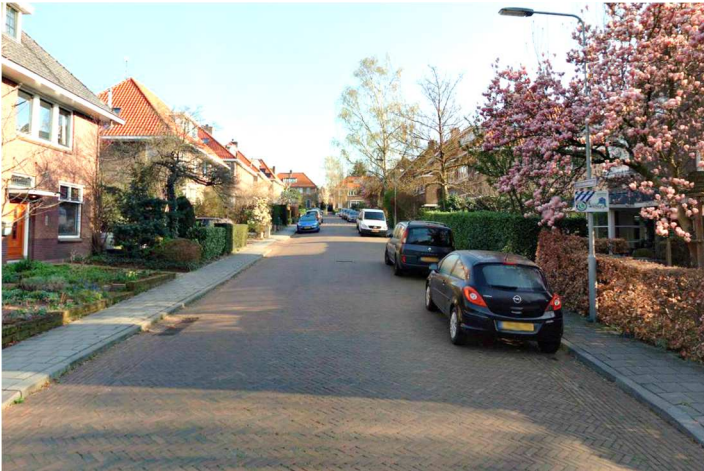
Hobbemastraat (10m breed)

1. Alle mogelijke profielen voor de straten zijn op een rij gezet. Hier hebben we alle profielen voor éénrichtingsverkeer en profielen met te smalle parkeerstroken en te smalle trottoirs uitgestreept. Na buurtonderzoek bleek dat de profielen die overbleven overeenkomen met de profielen in Gulden Bodem. Ons voorstel zou zijn om de smalle straten in te richten zoals bijvoorbeeld de Hobbemastraat en de brede straten zoals de Van Goyenstraat (maar dan met alleen bestaande bomen aan één zijde). In de Hobbemastraat is te zien dat de rijbaan iets breder is en dat de auto's niet op de stoep geparkeerd staan.